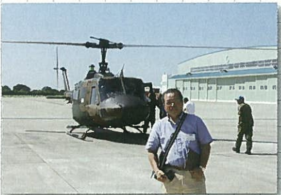
9月1日 ヘリコプター体験(目達原自衛隊)