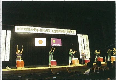
7月29日 知的障がい児・者研修大会