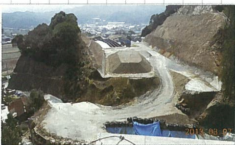
3月7日 現地視察(巖木バイパス)