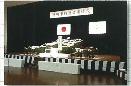
11月6日 神崎市戦没者追悼式