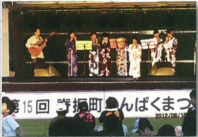
8月15日 脊振町わんぱくまつり