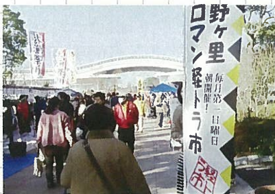
2月3日 吉野ヶ里町軽トラ市