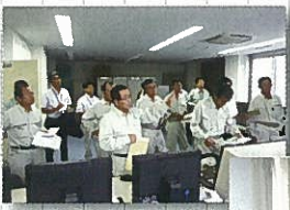
6月27日 現地視察 (川上頭首工)