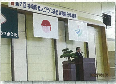
6月12日 脊振老人クラブ総会