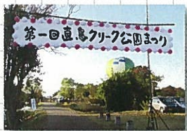
11月18日 第1回直島クレーク 公園まつり