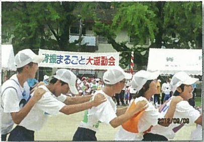
9月9日 脊振まるごと大運動会