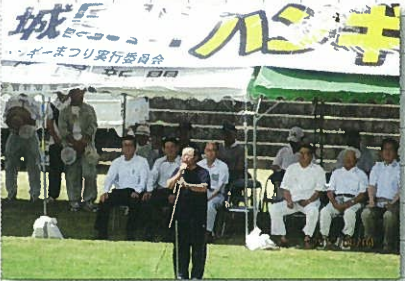
8月4日 城原川ハンギーマつり