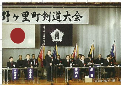
2月17日 吉野ヶ里町剣道大会