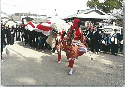
4月8日 櫛田宮みゆき大祭