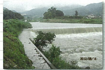
8月14日 城原川現地(朝日地区)