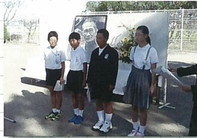
10月3日 下村湖人生誕祭