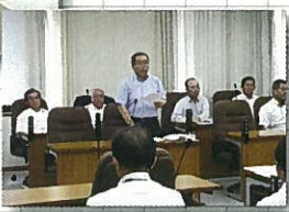
6月28日 土木水産 常任委員会