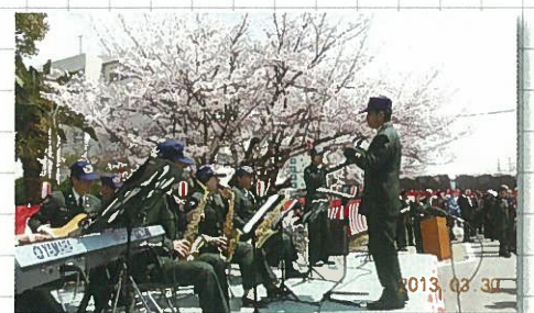
3月30日 観桜会(目達原自衛隊)