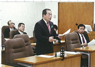
3月14日 地域経済・雇用対策特別委員会