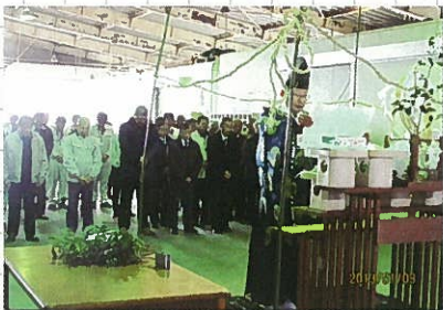
1月3日 JA神崎生産者協議会初荷式