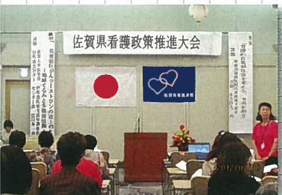
7月10日 佐賀県看護政策推進大会