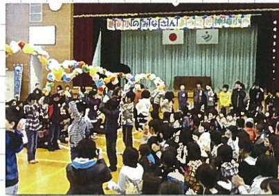
11月18日 福島県葛尾小学校(ようこそ神崎小へ)