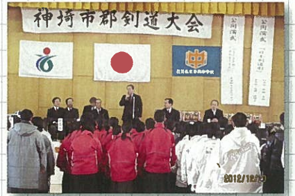
12月23日 神崎市郡剣道大会