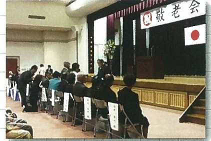
9月16日 吉野ヶ里町敬老会