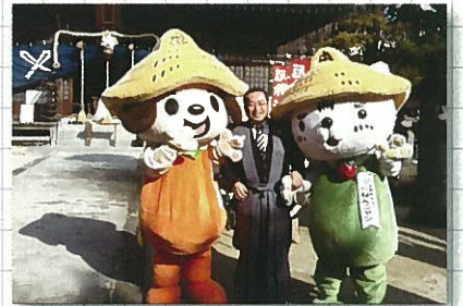
2月2日 節分祭(櫛田宮)