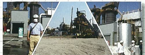
8月24日 宮城県岩沼処理区ガレキ処理視察