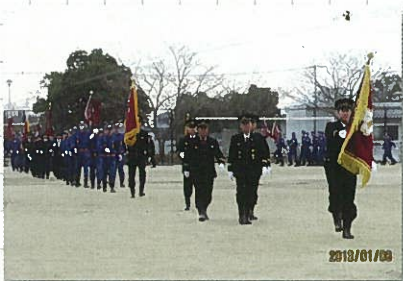
1月6日 吉野ヶ里町出初式