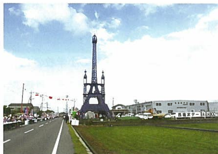
佐賀さくらマラソン