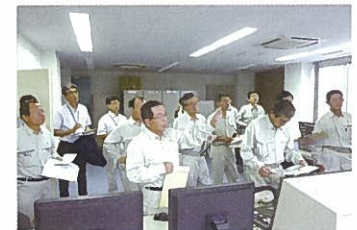
土地改良施設視察