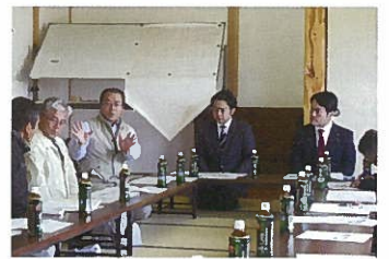
国営三田川線排水対策