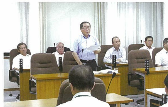
総合交通対策特別委員会