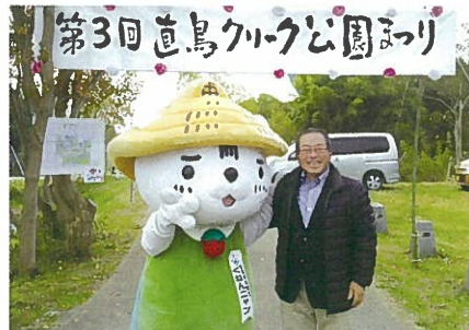
直鳥クリーク公園まつり