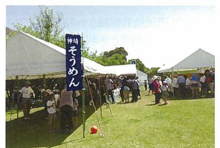
吉野ヶ里歴史公園そうめん流し