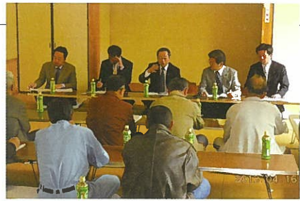
城原川ダム勉強会