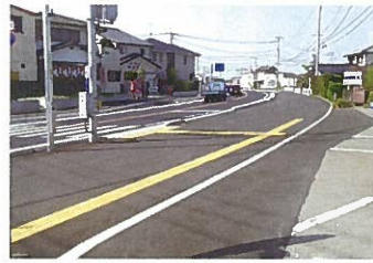
国道264号千代田西部小付近