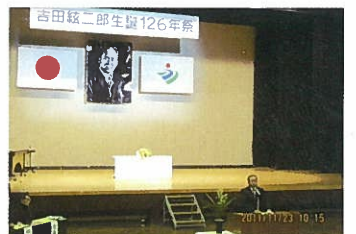
吉田絃二郎生誕祭