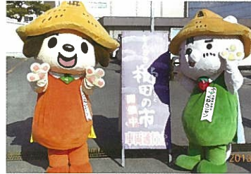
櫛田の市(毎月第1土曜日)