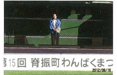
脊振町わんぱくまつり