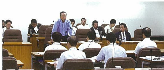
県土整備常任委員会