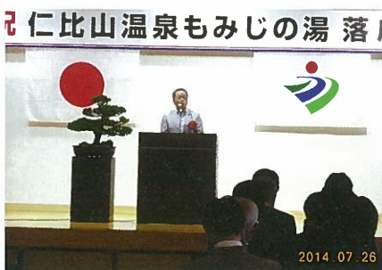
仁比山温泉もみじの湯 落成式