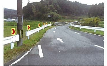
中原三瀬線田中橋