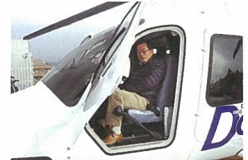
ドクターヘリ視察