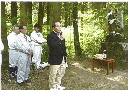
成富兵庫茂安公を称える「兵庫祭り」