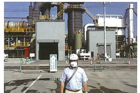
東日本大震災ガレキ処理場