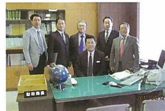
札幌市財政局長室にて