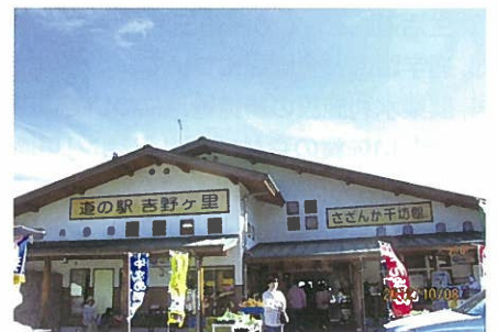
道の駅さざんか千坊館