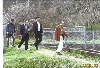
城原川ダム水没予定地を知事と