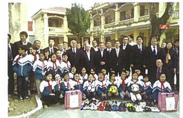
ベトナムの小学生へサッカーボールを