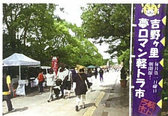
吉野ヶ里軽トラ市 (毎月第1日曜日)