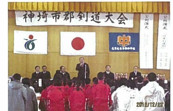
神崎市郡剣道大会