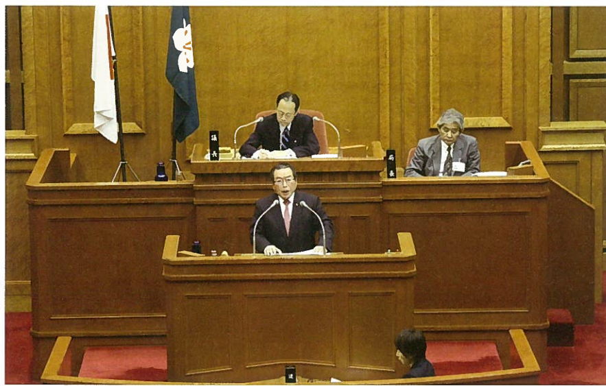
本会議場（一般質問）