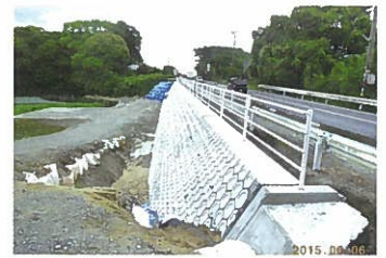
佐賀川久保鳥栖線志波屋