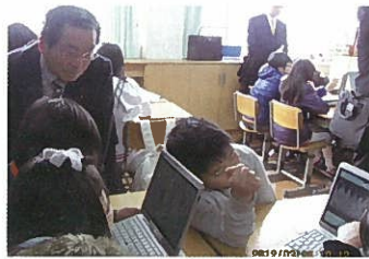
韓国の小学校の ICT 教育視察