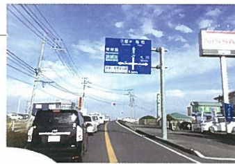
国道34号田手橋付近の渋滞