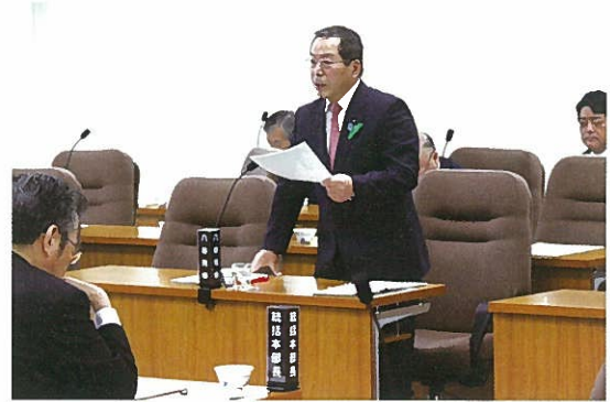
地域経済・雇用対策特別委員会