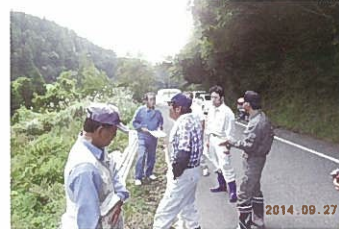
イノシシ被害調査